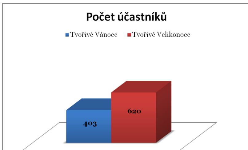
Graf č. 2: Návštěvnost Tvořivých Vánoc 2012 a Tvořivých Velikonoc 2013

Na základě velkého zájmu o Tvořivé Vánoce jsem se rozhodla, vytvořit Tvořivé Velikonoce. Program Když přichází jaro se nakonec stal ještě úspěšnějším než vánoční programy, což upevnilo mé rozhodnutí pokračovat v cyklech tvořivých svátků jara i zimy také v dalších letech.